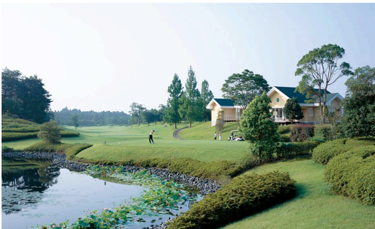
▲フェアウェイフロントの温泉付き別荘